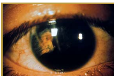
Lenti protesiche dipinte a mano

Le lenti protesiche o cosmetiche per patologia , possono essere costruite con materiali morbidi o gaspermeabili. Il loro utilizzo è richiesto a seguito di traumi, malformazioni congenite, interventi chirurgici, degenerazioni corneali etc. e quindi si rende necessario l'accoppiamento con l'occhio sano.